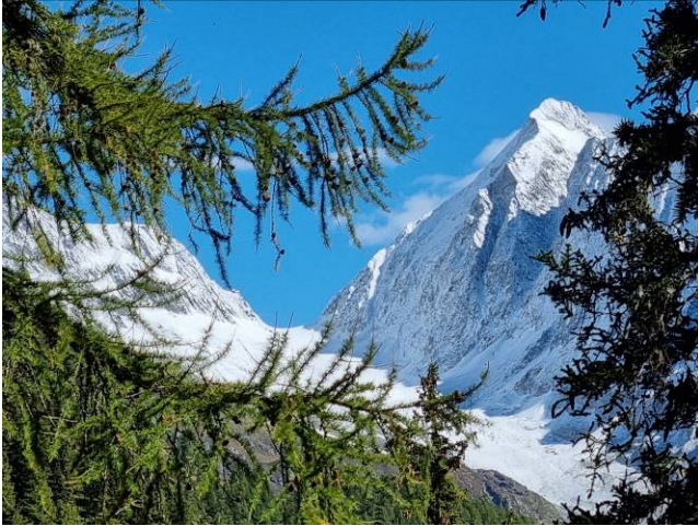
Auf dem Lötschentaler Höhenweg