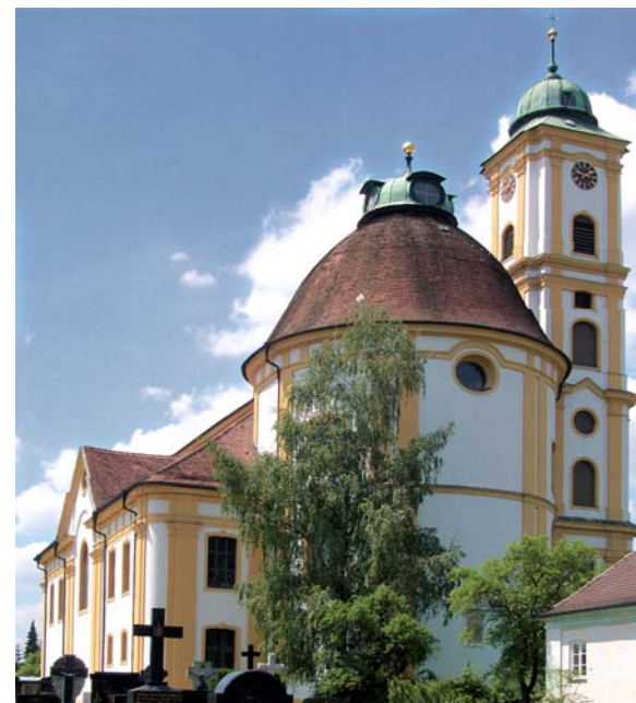
Wallfahrtskirche „Unseres Herrn Ruh“ (Herrgottsruh) in Friedberg